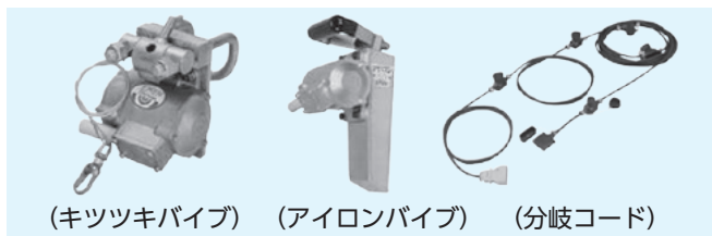
(キッツキバイブ) (アイロンバイブ) (分岐コード)