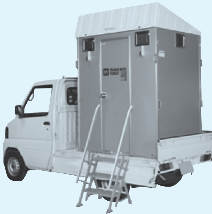
NETIS登録商品 番号: CB-100037-A