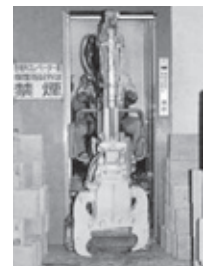
●エレベーターでの移動が可能