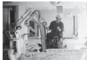
●低騒音だから病院内・デパート内での内装解体も