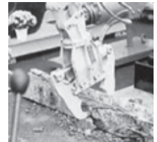
●PC枕木も砕くパワー