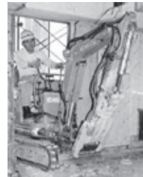
●アパート・団地・マンションの間口からも