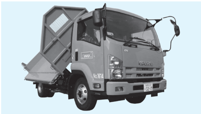
4t3転ダンプサイドテール